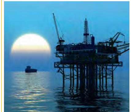
The system aims to improve reliability and efficiency of offshore tieback operations

In addition, the product features a series of hangers with landing and load rings located on load shoulders to transfer the weight of each casing string to the conductor and the seabed while drilling from a jack-up.