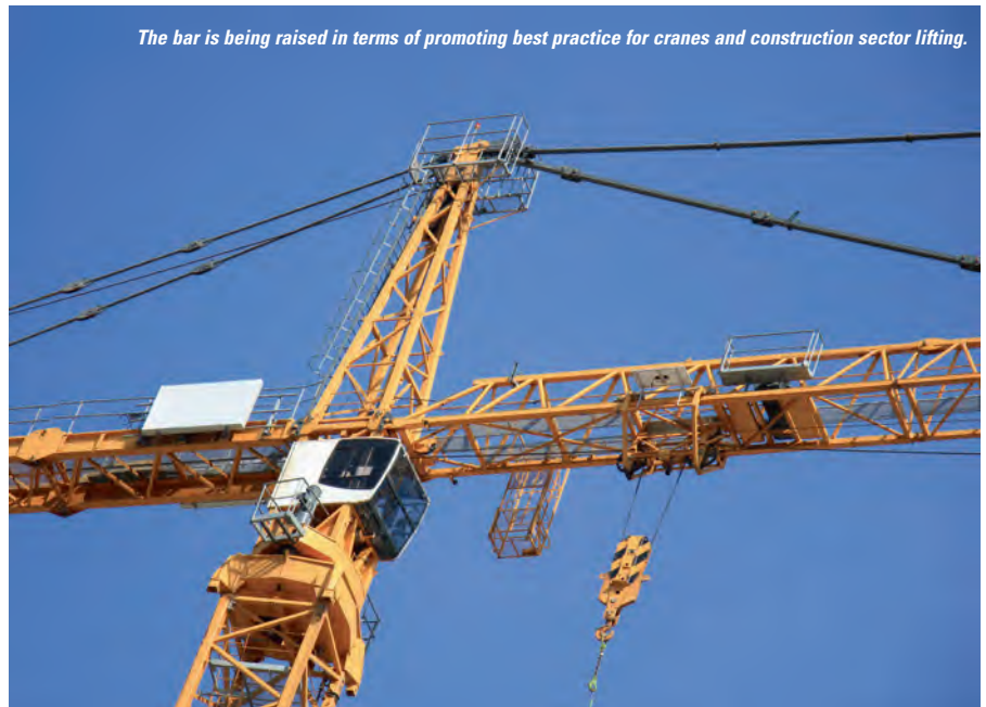
The bar is being raised in terms of promoting best practice for cranes and construction sector lifting.

Based in Dubai, and operating across the Gulf, its remit is to ensure that machines are safe, and compliant with any