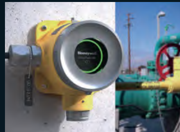
این آشکارساز را می‌توان از راه دور با استفاده از یک برنامه تلفن هوشمند نصب و نگهداری کرد.

هانیول اعلام کرد که یک دکتور گاز متصل جدید در خاورمیانه در دسترس است.