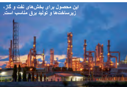
این محصول برای بخش‌های نفت و گاز، زیرساخت‌ها و تولید برق مناسب است.