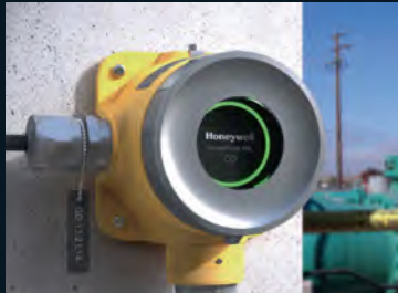
The detector can be set up and maintained remotely using a smartphone app

The new Sensepoint XRL fixed gas detector is designed to keep industrial operations safe while making set-up, maintenance and compliance reporting faster and easier by leveraging Bluetooth