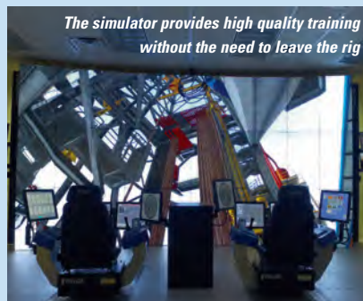
The simulator provides high quality training without the need to leave the rig

The OTR system offers comprehensive training and competence modules for operations including well control, drilling practices, BOP landing, lower marine rising packages (LMRP) disconnects, managed pressure drilling, Drill-well-on-sim (DWOS), complex lifts, banksman, human factors/CRM, operational readiness, lifting and deck operations. With 3D simulation and an easy to use learning management interface, the system provides both self-led or instructor supported learning in a way that helps personnel better retain information and learn how to apply theoretical knowledge.