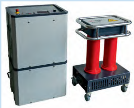
The TDM 45 series offers greater user safety through automatic discharge of the test object and earth loop ground monitoring

The TDM 45 series combines many features and functionalities in one single test system. It delivers high testable capacity of 5 \mu\text{F} @ 0.1Hz and 40kVrms up to 10 \mu\text{F} at lower test voltage levels and AC/DC testing in compliance with DIN VDE, EN, IEEE and with up to three different voltage waveforms. It also provides DC voltage testing with positive and negative polarities up to 45kV, sheath testing and sheath fault pinpointing with up to 20kV negative DC voltage according to IEC 60229. It comes with breakdown detection with automatic disconnection of test voltage and discharging of the test object if the charging current is too high, and has an intuitive user software with large internal memory.