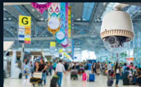
There is a rising demand for surveillance equipment in the Middle East

"Internal police forces and public infrastructure projects, including street utilities, public car parking, stadiums, roads and buildings, will create huge demand as regional countries, especially in the GCC, look to create a smart and secure environment," he added.