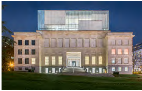
sedak's glass has been used in a number of iconic buildings