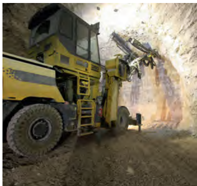
Efficient and environment-friendly extraction of raw materials is becoming increasingly important in Iran

China had a bigger role at this year's exhibition, together with Germany, Iran's leading foreign trading partner. Fifteen Chinese companies displayed their product portfolio at a joint stand organised by the China International Contractors Association (CHINCA). There was also an additional Chinese trade fair pavilion featuring some 40 exhibitors, as well as joint stands for German and Italian companies.