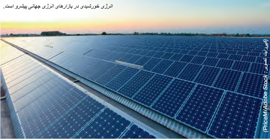
انرژی خورشیدی در بازارهای انرژی جهانی پیشرو است.

این امر تأثیر عمده‌ای بر بازارهای نفت و گاز دارد، تأمین‌کنندگان فعلی را به چالش کشیده و تغییرات عمده‌ای را در جریان تجارت جهانی پدید می‌آورد به‌طوری که در سال 2040 مصرف‌کنندگان آسیا بیش از 70 درصد واردات نفت و گاز جهان را انجام می‌دهند.