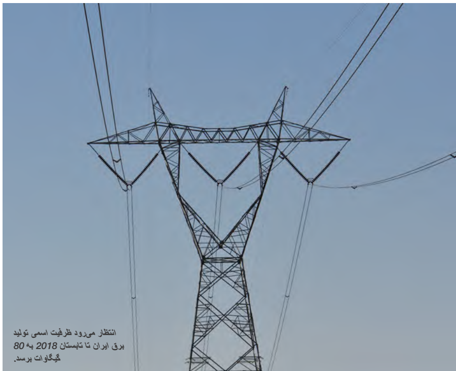
انتظار می‌رود ظرفیت اسی تولید برق ایران تا تابستان 2018 به 80 گیگاوات برسد.