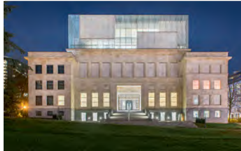
شیشه‌های سداک در چندین ساختمان مشهور مورد استفاده قرار گرفته است

شرکت سداک، شرکت آلمانی سازنده شیشه، از خط محصول جدید IGU خود موسوم به "سداک ایزومکس" و نمونه‌ای از نمای تمام‌شیشه‌ای در رویداد Big 5 که از 26 تا 29 نوامبر در دبی برگزار شد، رونمایی کرد.