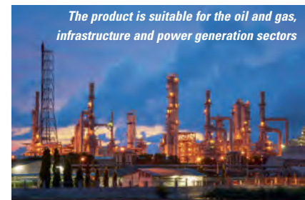
The product is suitable for the oil and gas, infrastructure and power generation sectors

development and improved cracking resistance, it is possible to move the coated steel or even build upon it faster, with a reduced risk of damaging the coating. This decreases the need for reblasting and recoating, saving time and money.