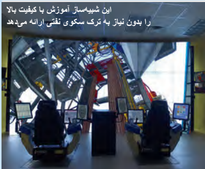
این شبیه‌ساز آموزش با کیفیت بالا را بدون نیاز به ترک سکوی نفتی ارائه می‌دهد

شرکت سیستم‌های حفاری (Drilling Systemes) که متخصصی برجسته در زمینه راحت‌های شبیه‌سازی است، انتشار نسخه جدید بسته شبیه‌ساز (OTR) سایت کاری سیار ("On the Rig") خود را اعلام کرده است. این شبیه‌ساز پیشرفته دوره‌های آموزش چندرشته‌ای انعطاف‌پذیر و قابلیت‌های زیاد دیگری را فراهم می‌کند تا امکان آموزش، توسعه و ارزیابی جامع پرسنل با استفاده از یک راه حل کاملاً سیار فراهم گردد.